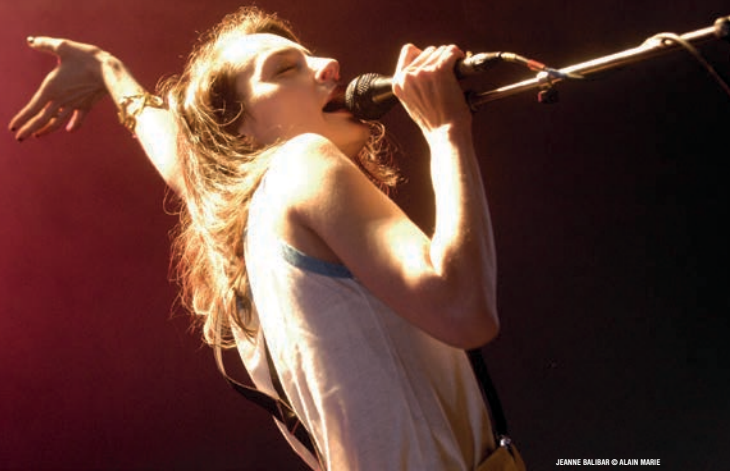
JEANNE BALIBAR