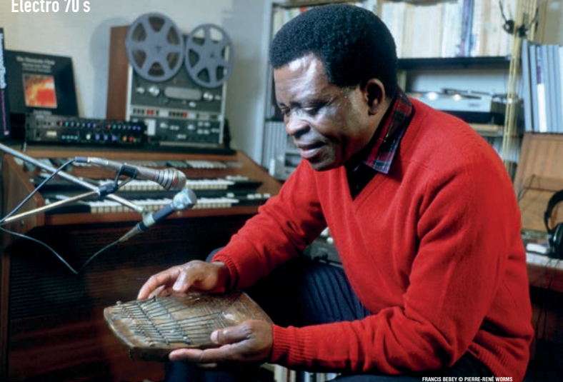
FRANCIS BEBEY