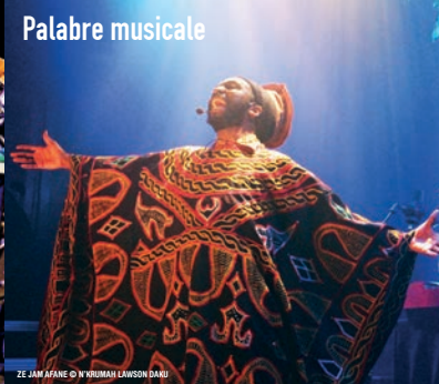
© ZE JAM AFANE © N'KOUYATÉ LARSON DUKU