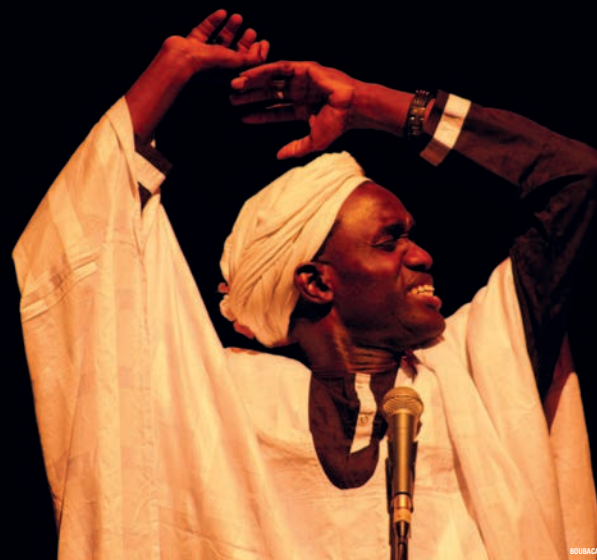
BOUBACAR NDIAYE © SIAMKA SOPPO TRADÉ