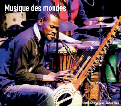
© SOUMANO © N'KOUYATÉ LARSON DUKU