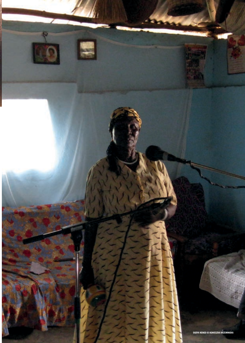
OGOYA NENGO